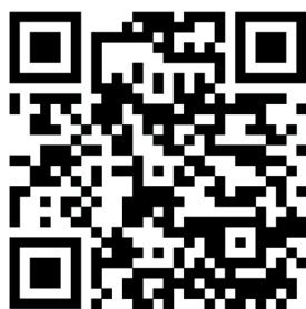
Академия Росмолодежь. Гранты