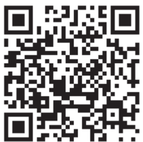
Фонд президентских грантов