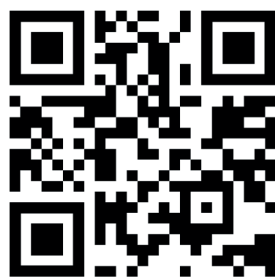
Департамент молодежной политики Оренбургской области